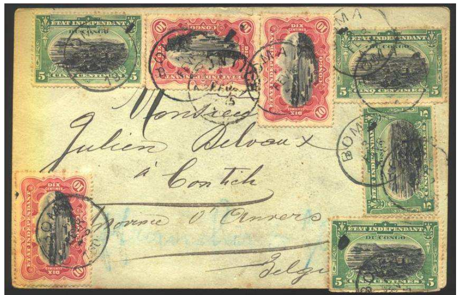
Figure 2 - collection privée