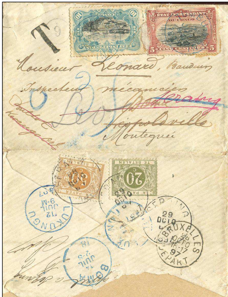
Figure 3

'Postage Due' was charged at 70 centimes, ( represented by the 20c and 50c postage due stamps ) being double that of the underpayment.