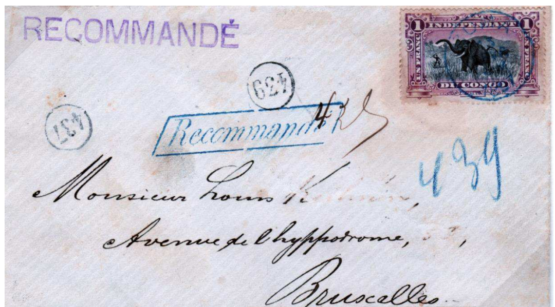
Fig. 3 shows another cover sent in 1897 this time to Brussels. This was also posted at the 1 Fr registered letter rate. This cover left Boma on 13th February and arrived in Brussels on 17 th March.

La figure 3 montre une autre enveloppe envoyée en 1897, cette fois vers Bruxelles. Elle a également été affranchie au tarif de la lettre recommandée à 1 Fr. Cette enveloppe a quitté Boma le 13 février et est arrivée à Bruxelles le 17 mars.