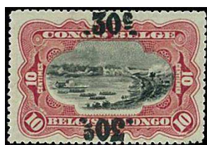
surcharge double dont 1 renversée