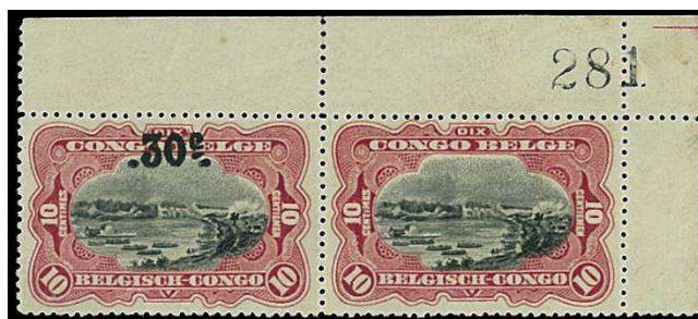
paire dont 1 timbre non surchargé