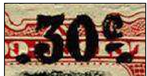
Surcharge agrandie à 500 %