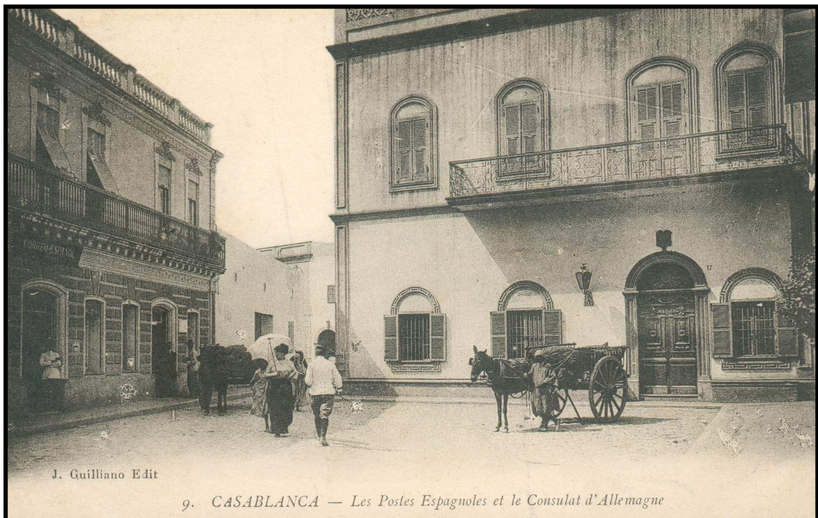
Consulat espagnol à Casablanca vers 1910 A noter sur la gauche l'enseigne Correos Español. (à droite Consulat d'Allemagne)