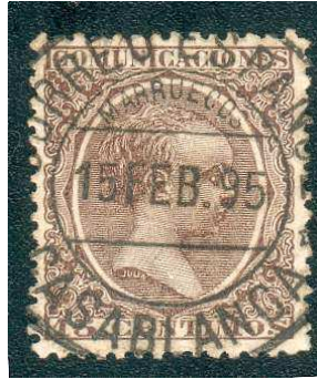
Type 4 : 15 février 1895