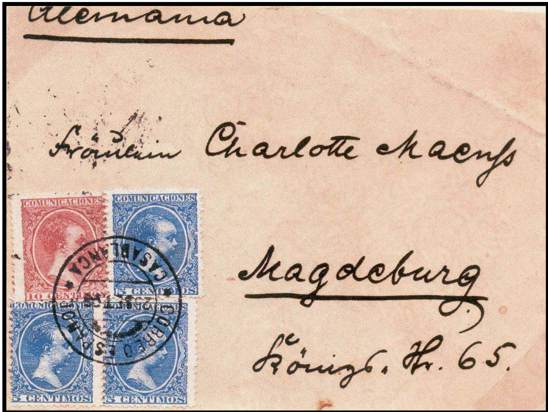
Lettre de Casablanca pour Magdebourg (Allemagne) du 4 Octobre 1898. Affranchissement par 4 timbres d'Espagne type Alphonse XIII (3x 5centimos + 10 centimos) = 25 centimos, tarif lettre 1 er échelon pour l'Europe. TAD type 5 (ex-collection Frassati).