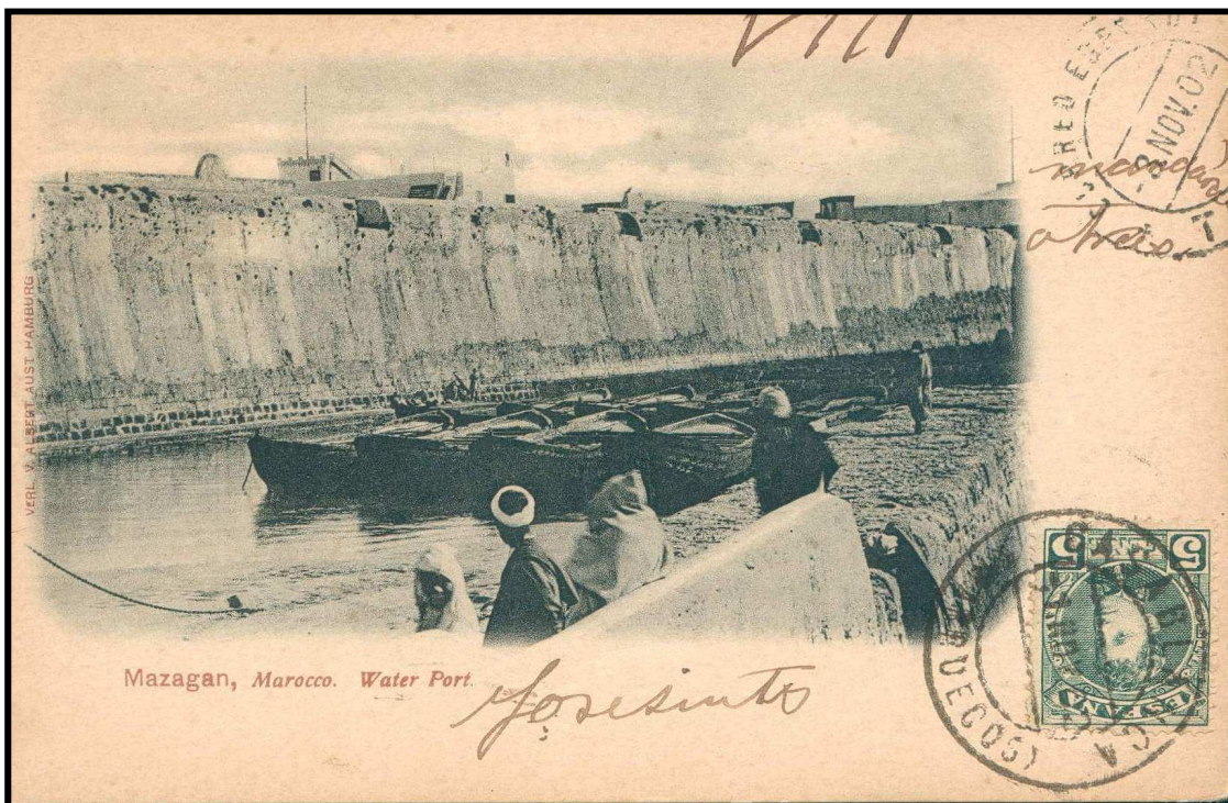
Carte postale de Mazagan oblitérée à Casablanca pour Barcelone le 1 er Novembre 1902 Affranchissement 5 centimos, tarif CP moins de 5 mots. TAD type 8.