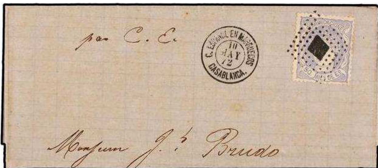
Lettre de Casablanca pour Mazagan (?) du 10 Mai 1872(ex-collection Frassati) TAD type 1 et griffe type 2

Cette lettre est adressée Joseph Brudo probablement à destination de Mazagan ; la lettre étant découpée en bas, ne permettant pas de localiser la ville d'arrivée. Comme Brudo était vice-consul de France dans cette ville côtière, nous supposons que la destination de cette lettre est bien Mazagan.