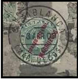
Type 8 : 3 avril 1908