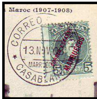
Type 6 : 13 novembre 1908