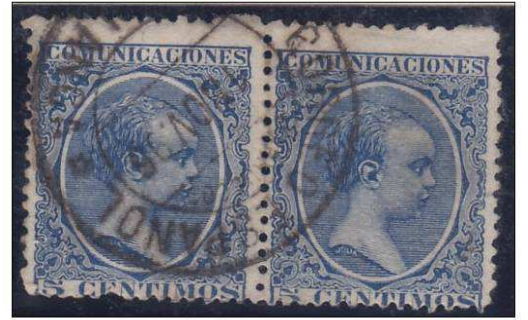
Type 4 : 4 novembre 1896