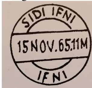
TAD type 4 du 15 novembre 1965.

Type 4. TAD double cercle portant la légende SIDI IFNI en haut, et IFNI en bas, la date au milieu sur une ligne le mois en abrégé et le millésime à deux chiffres entre deux traits.