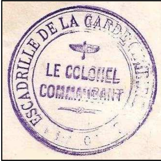
Estampille de l'Escadrille de la Garde Chérienne- Le Colonel Commandant