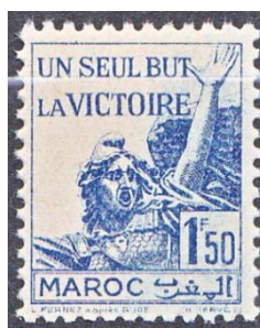
N°223a bleu clair