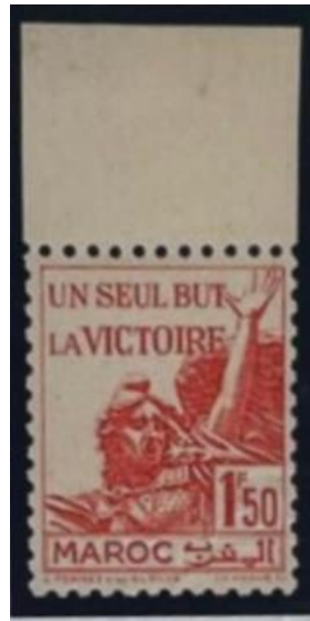
N°223c rouge au lieu de bleu