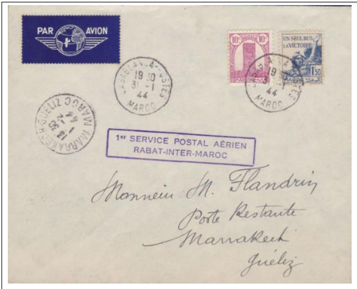
Lettre aérophilatélique commémorant la réouverture de la liaison aérienne inter-Maroc par le service postal militaire. Lettre de Casablanca pour Marrakech du 31 Janvier 1944. Affranchissement 1F60 (le timbre de la Tour Hassan est superfétatoire) ; tarif lettre 1 er échelon 1F50.