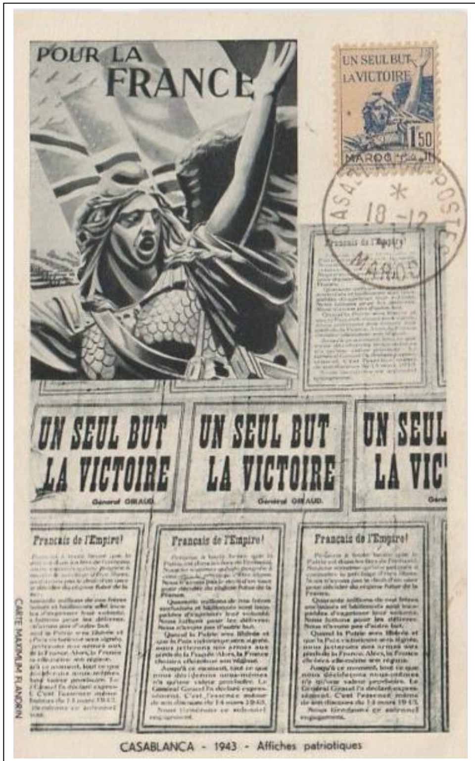
Carte maximum éditée à Casablanca et affranchie avec la « Marseillaise ». Oblitération du bureau de Casablanca du 18 décembre 1943.