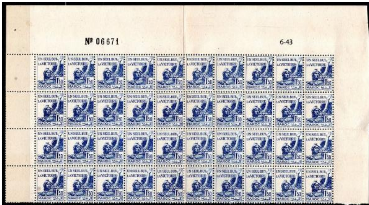
Fragment de planche numéroté et daté de Juin 1943

Nous avons vu 6 planches ou fragments de planches de ce timbre, elles sont toutes datées du 6-43.