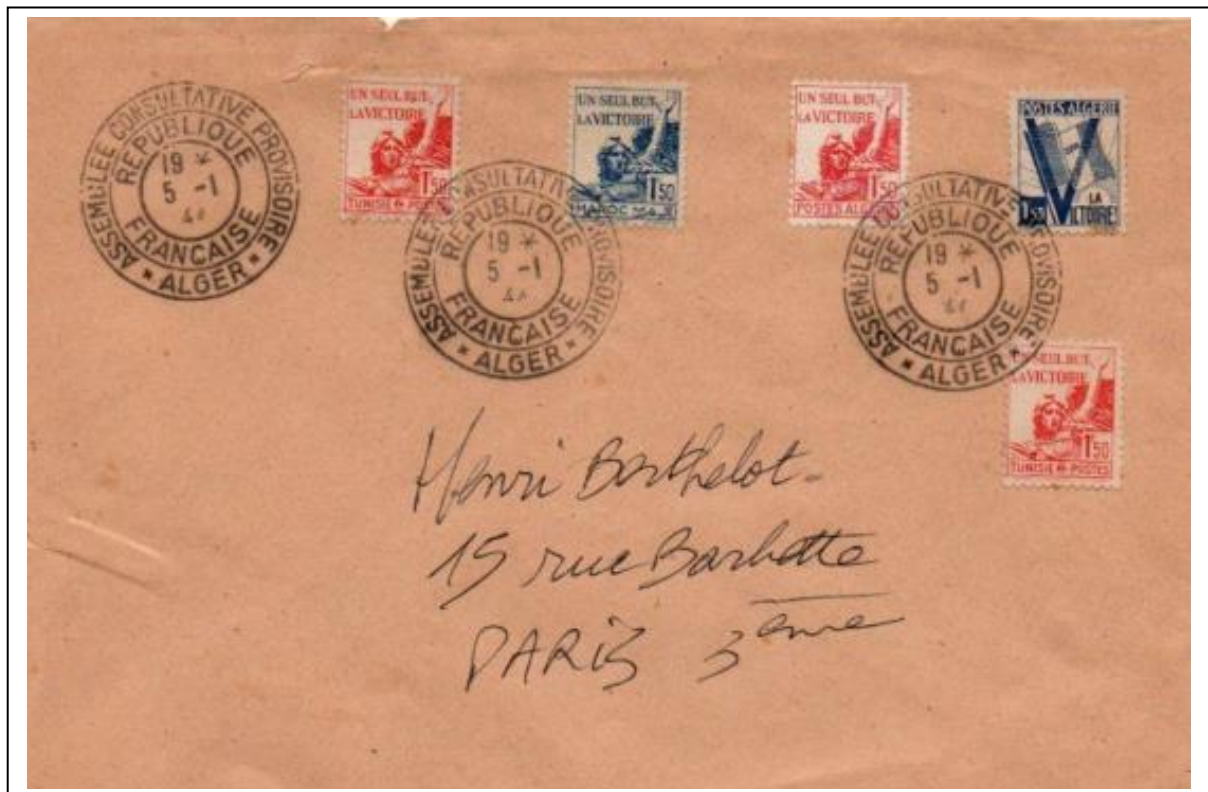
Lettre philatélique pour Paris affranchie avec les 3 timbres de la « Marseillaise » : Maroc, Algérie et Tunisie, et le timbre de « la Victoire » d'Algérie. Oblitération de l'Assemblée Consultative Provisoire d'Alger du 5 Janvier 1944.

Contrairement à ce que signale le bulletin de la Philatélie du Maroc, ce timbre est peu courant sur lettre ayant réellement voyagé. On le trouve dans des documents philatéliques issus des milieux philatéliques.