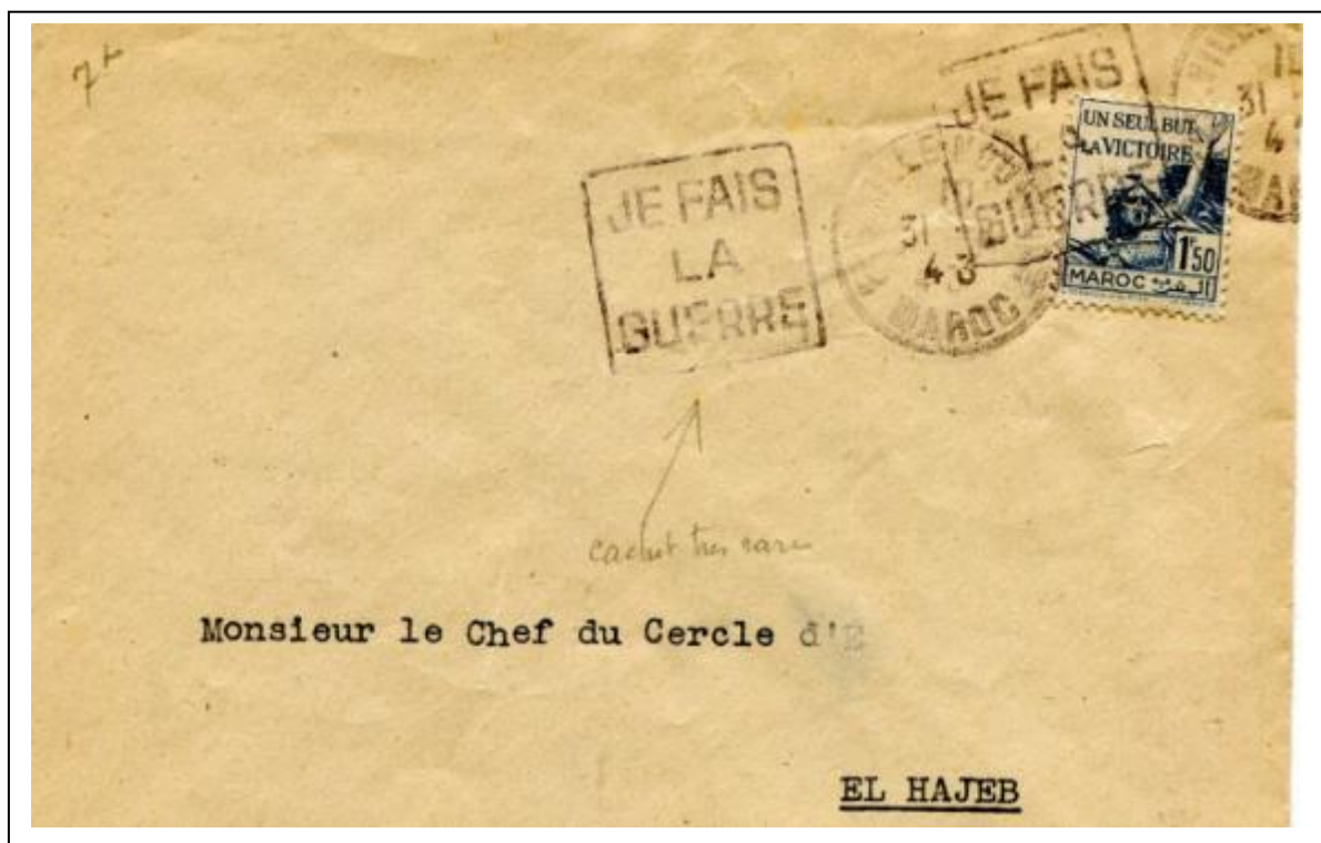
Lettre peu courante locale de Fès Ville Nouvelle pour El-Hajeb du 31 Août 1943. Affranchissement lettre 1 er échelon. Oblitération Daguin « Je Fais la Guerre ».