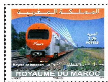
Emission du 14 décembre 2010

En 1983 pour l'Année Mondiale des Communications, un timbre représente les divers moyens de déplacements, à savoir, bateau, avion et train