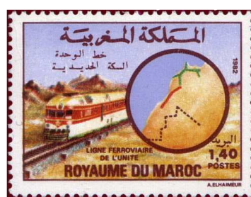
Emission du 06 novembre 1982