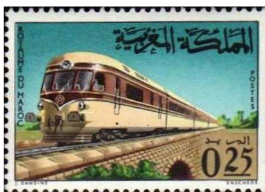
Emission du 17 décembre 1966

D'autres émissions régulières ont par la suite été réalisées avec les timbres-poste « Transports » en 1966,