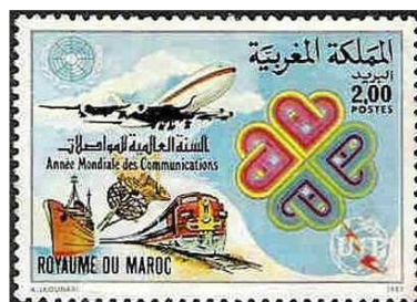
Emission du 06 novembre 1982

ou encore le timbre commémoratif du cinquantième anniversaire de l'ONCF en 2014.