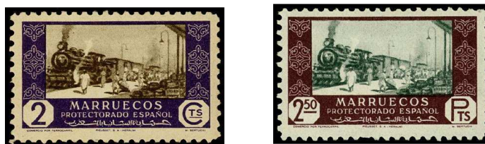
Emission du 01 janvier 1948

Dès 1948, un timbre-poste a été consacré au « Train Marocain ».