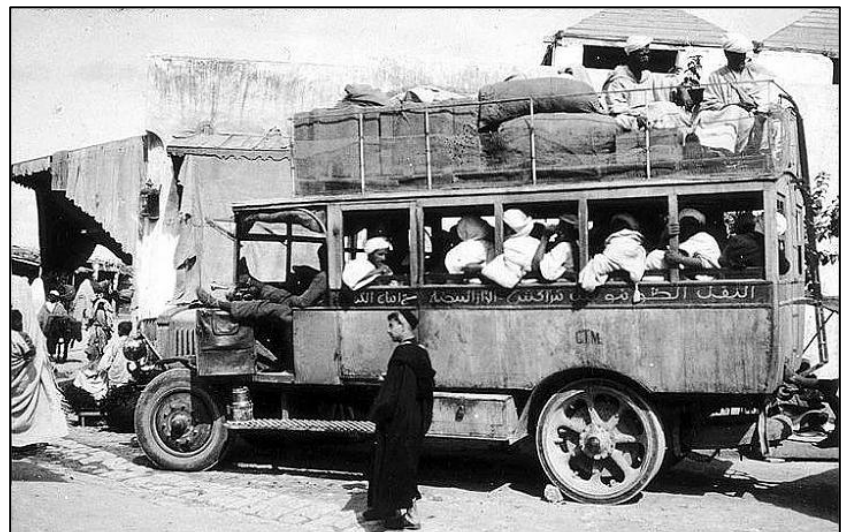
Départ de Meknes en 1940