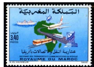
Emission de 1992