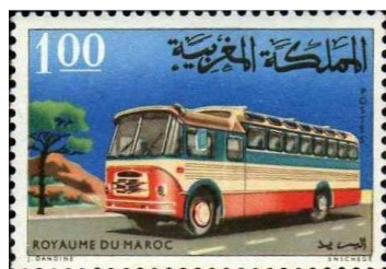
Emission de 1966

Citons principalement ”Moyens de Transport au Maroc” en 1966, ”Décennie des Transports et Communications en Afrique” en 1992 et ”26 ème Congrès de l’Union Internationale des Transports” en 1998.