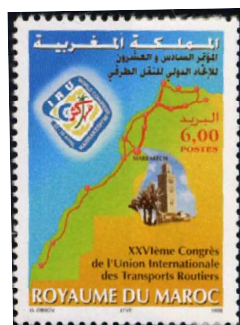
Emission de 1998