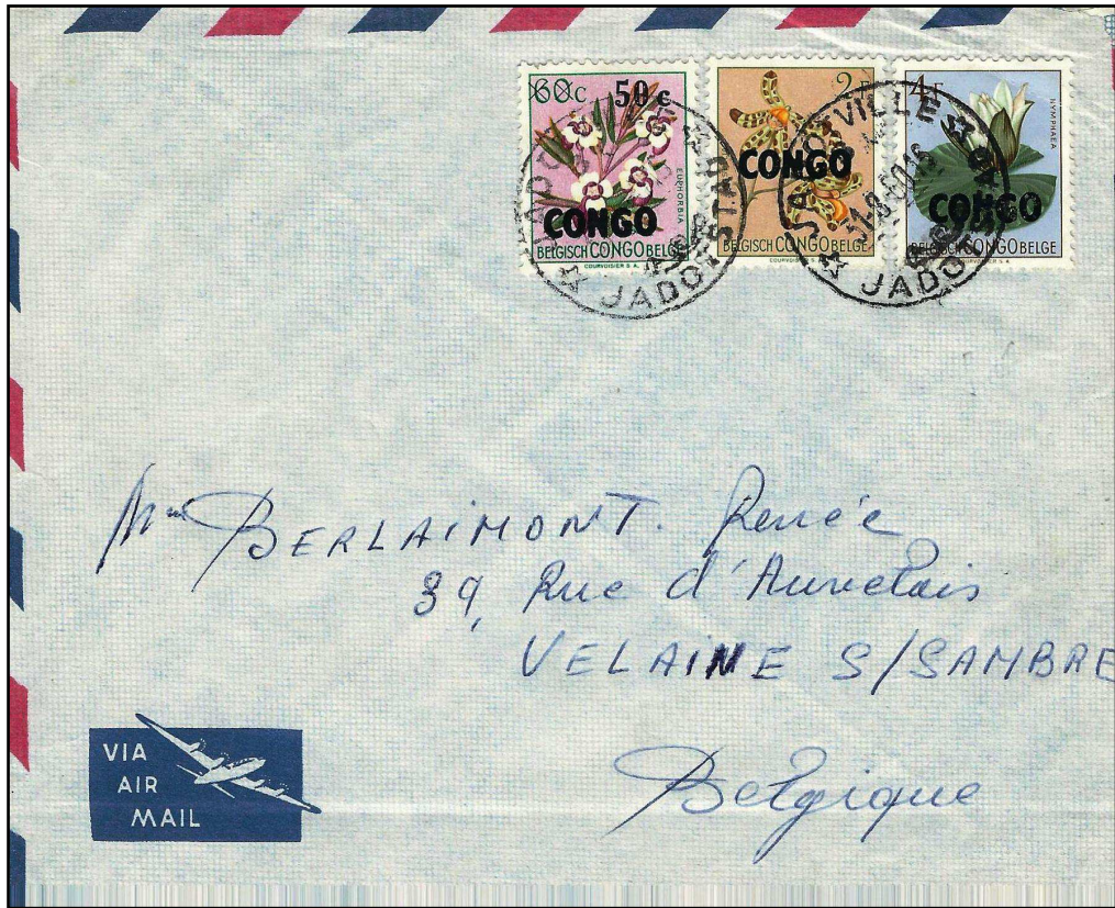
Lettre par avion expédiée de Jadotville le 31 août 1960 à destination de Velaine sur Sambre. Tarif des lettres de 10 gr vers la Belgique à 6.50 F (taxes combinées) – archive Berlaimont. Affranchissement « Fleurs » surchargés 2F, 4F & 50c/60c (timbre rare sur pli).