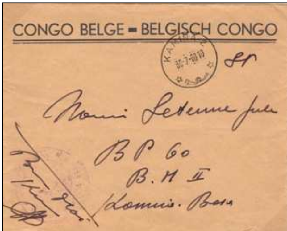
Lettre administrative (avec entête non modifiée) expédiée de Kamina-2 le 30 juillet 1960 à destination d’une boîte postale à la Base Militaire II de Kamina. Franchise postale en Service Public SP.