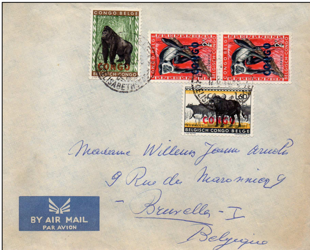
Lettre par avion expédiée d'Elisabethville 1L le 17 août 1960 à destination de Bruxelles. Tarif des lettres de 10 gr vers la Belgique à 6.50 F (taxes combinées). Affranchissement « Animaux » surchargés 1F & 1.50F (surch ROUGE ) + 2F (surch BLEUE ).