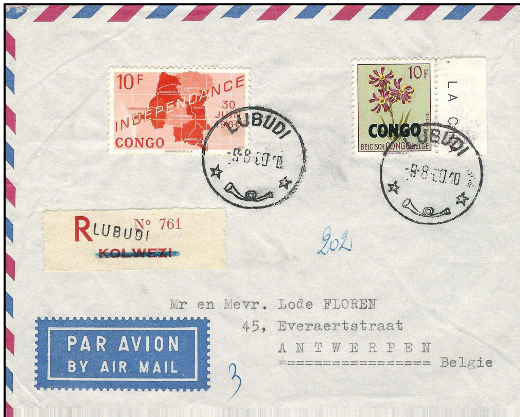
Lettre par avion en recommandé expédiée de Lubudi le 9 août 1960 à destination d'Anvers. Tarif des lettres de 25 gr vers la Belgique à 14 F (taxes combinées) + recommandation (6F) = 20F. Archive Floren – Affranchissement 10F Independance & 10F Fleurs surchargé CONGO. Etiquette de recommandation de Kolwezi (biffée) utilisée à Lubudi avec la griffe du bureau.