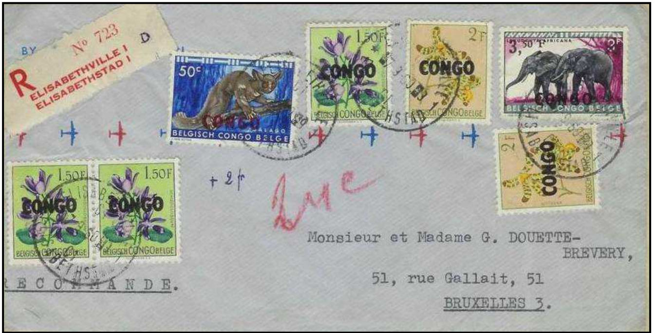
Lettre par avion en recommandé expédiée d'Elisabethville le 7 septembre 1960 à destination de Bruxelles. Tarif des lettres de 10 gr vers la Belgique à 6.50 F (taxes combinées) + recommandation (6F) = 12.50F. Affranchissement : 50c & 3.50F/3F Animaux surchargés et 1.50F & 2F Fleurs surchargé CONGO.