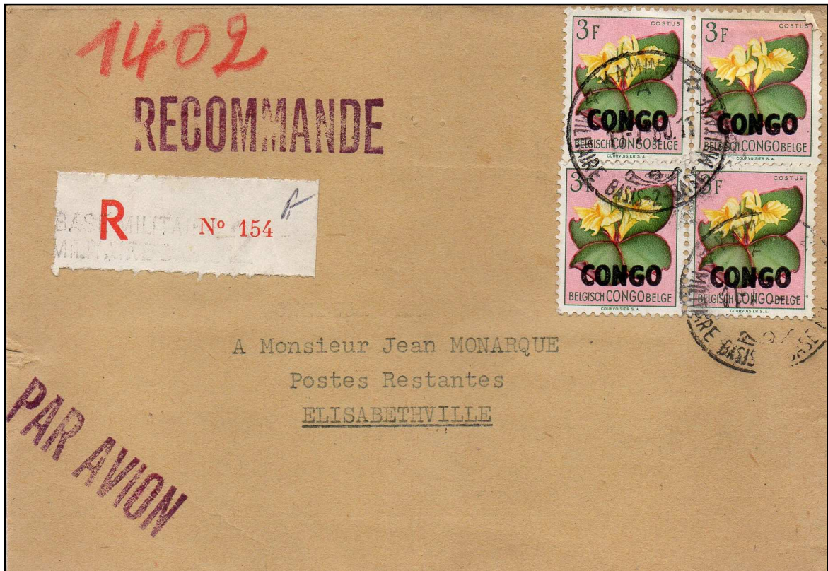
Lettre en recommandé pesant 15gr expédiée de Kamina – Base Militaire 2A le 11 juillet 1960 à destination d’Elisabethville ( 1 er jour de la Sécession Katangaise )

Tarif du 30.06.60 des lettres en service intérieur: 3.50 Fr (10gr) - 1.50 Fr par 5 gr supplémentaires + Recommandation à 6F.