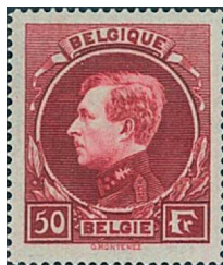
50 Fr. lie-de-vin carminé