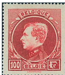
100 Fr. carmin-rouge