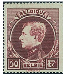
50 Fr. lie-de-vin brunâtre