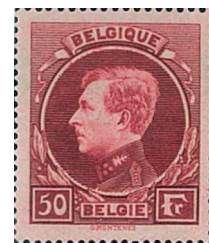
50 Fr. lie-de-vin rosé