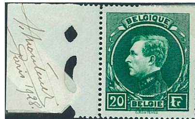
20 Fr. Vert