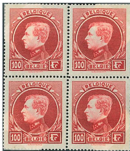
100 Fr. carmin-brun