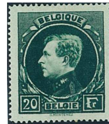
20 Fr. Vert-noir