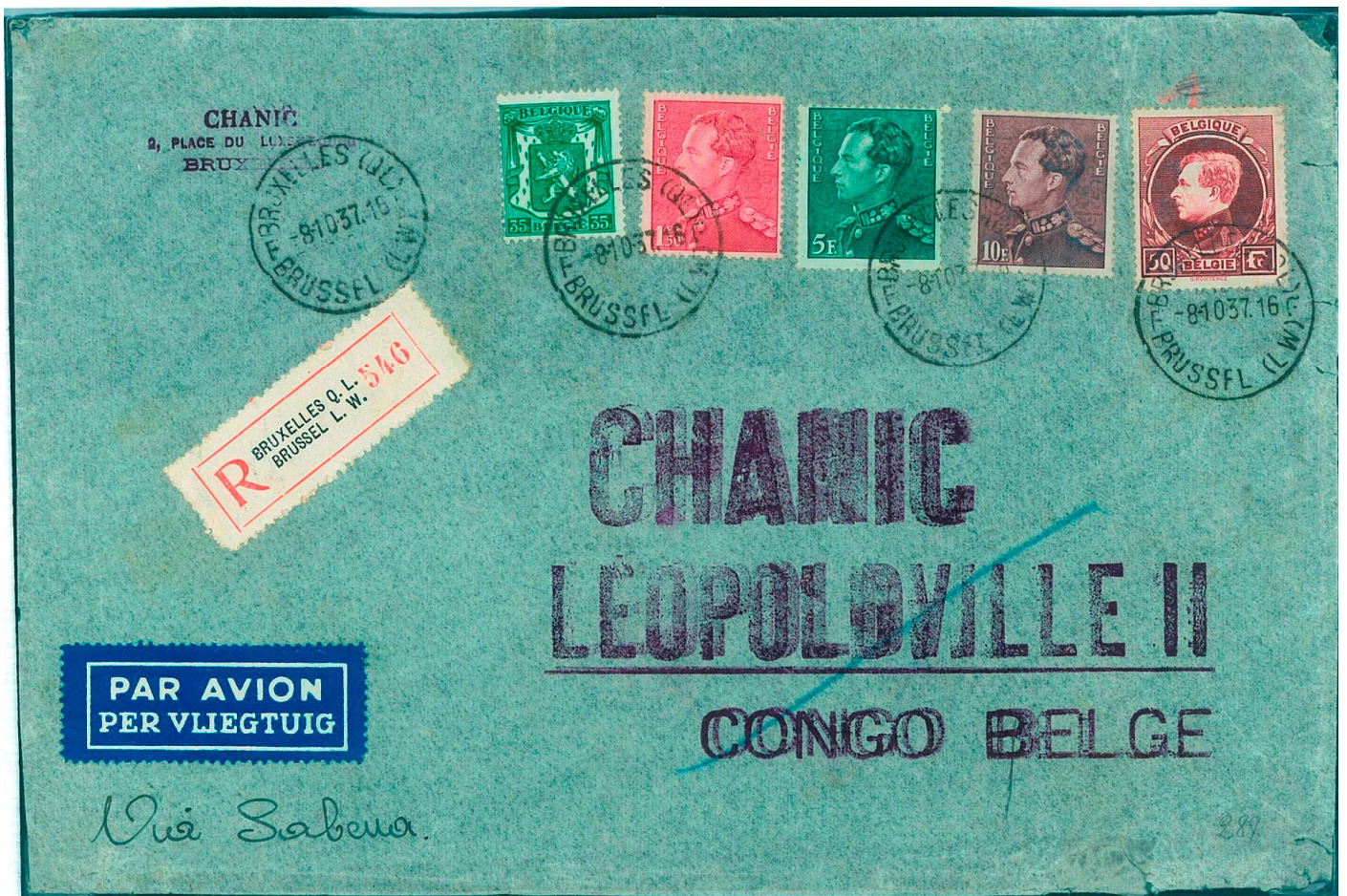
Lettre recommandée par avion partie de Bruxelles le 8/10/1937 à destination de Léopoldville. Tarif : lettre entre 96 et 100gr. affranchie à 66.85 Fr. (dont un 50Fr. lie-de-vin foncé du tirage de Malines) Port simple 1.50 Fr. jusqu'à 20gr. + 4 ports supplémentaires x 0.90 Fr./20gr. + recommandation + 1.75 Fr. + surtaxe aérienne 20 x 3Fr./5gr. = 66.85 Fr.