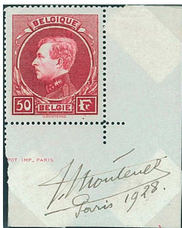
50 Fr. Lie-de-vin