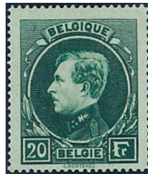
20 Fr. Vert-gris