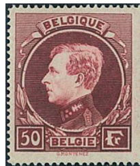
50 Fr. lie-de-vin foncé