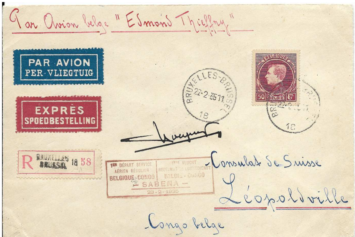
Brief getekend door de piloot COCQUYT / lettre signée par le pilote COCQUYT.