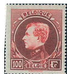
100 Fr. Carmin-brun foncé