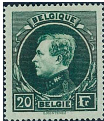
20 Fr. Vert foncé

Le tirage de Malines est composé de planche de 25 timbres (5x5) exécutée en taille-douce par la maison COTTENS de Paris à partir du coin gravé par MONTENEZ. Imprimée par l'atelier du timbre à Malines de 1930 à 1941. Plusieurs tirages furent exécutés avec des variétés importantes de nuances et d'impressions. Dentelure 14x14 ½. (Remarque: le 10 Fr. brun ne fut imprimé qu'à Paris).