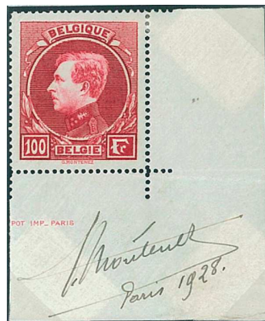
100 Fr. Carmin