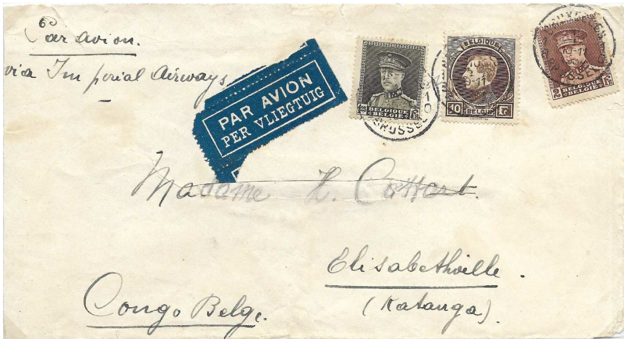
Brussel 10.1.1934 naar (vers) Elisabethville. 4 luchtposten (4 ports aériens): 12 fr.