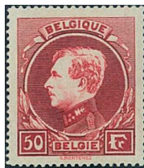
50 Fr. lie-de-vin rougeâtres